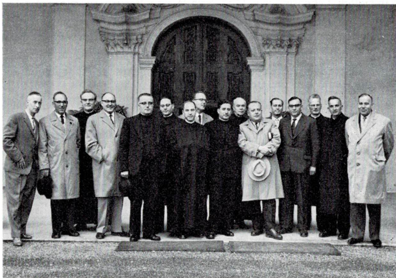
Tagung der Maturaklasse von 1934 in Muri